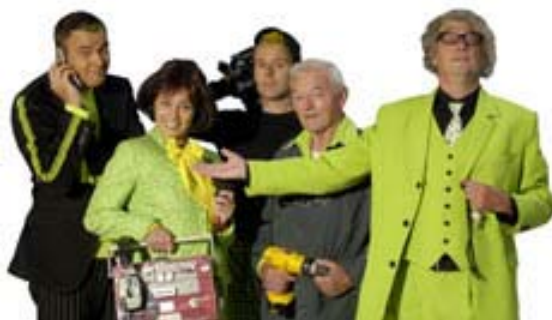
Studio F: schooltelevisie sluit aan bij nieuwe methode

In het volgende hoofdstuk werken wij de intensivering van ons integrale taalbeleid per onderwijssector nader uit.