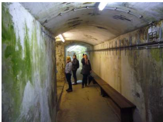
Ûnderierdsk gongestelsel fan Hilgelân

ren eigen Frysk. By it kraaltsjeriuwen (foar de tradisjonele klaaiïng) die bliken dat it noch net sa maklik wie om dy lytse dinkjes neffens it kreative patroan oan te bringen. Der wie mar ien dy't it úteinlik ta in goed einprodukt brocht. De politike wurkwinkel waard spontaan troch de leafhawwers sels organisearre en smiet kontakten en ôfspraken op om te besykjen yn de takomst ta in foarm fan bestjoerlike gearwurking te kommen en om materiaal foar ynter-Fryske skiednis gear te stallen dat yn de trije Fryslannen brûkt wurde kin.