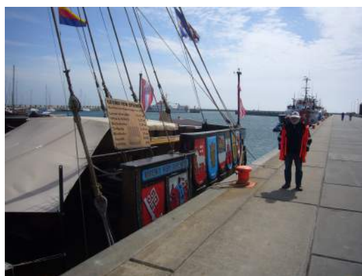
Koggeskip (replika) de 'Ubena von Bremen' yn de Suderhaven fan Hilgelân

Al mei al hawwe wy in pear prachtige en sinfolle dagen hân. Goed foar de ynter-Fryske kontakten. Yn de takomst soene wy noch wol mear Westerlauwerske Friezen nei Hilgelân ta hawwe wolle. Yn 2016, fan 3 o/m 5 juny, is it wer safier ( www.fryskerie.nl ). Komme jo ek?