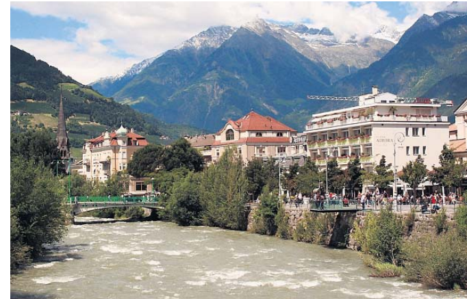
Merano in Zuid-Tirol is dit jaar gastheer voor de EFA.

king niet herinnerd worden. Naast de S d-Tiroler Freiheit zijn er meer regio's die naar volledige zelfstandigheid streven. In Itali  gaat het ook nog om de Liga Veneta Repubblica, de streek rond Veneti . In Finland zijn het de  land eilanden waar een Zweedse minderheid woont, in Duitsland Beieren, in het Verenigd Koninkrijk Wales en Schotland, in Spanje Baskenland en Cataloni , in Frankrijk de streek Savoie en in Belgi  Vlaanderen.